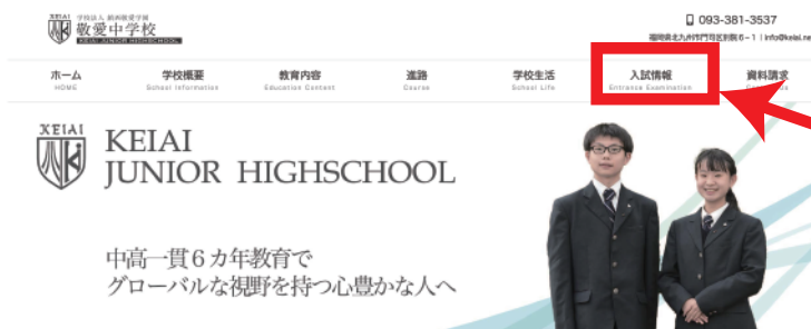
こちらの リンクから

※入試・募集要項は上の QR コードからアクセスするか、本校ホームページをご覧ください。