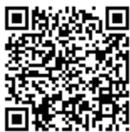
本学園ホームページ （入試情報リンク） QRコード