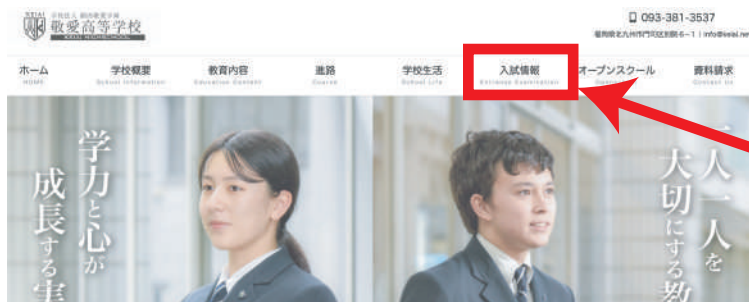
こちらの リンクから

③ メールアドレスを入力し、利用規約をご確認いただき、「送信する」をタップしてください。